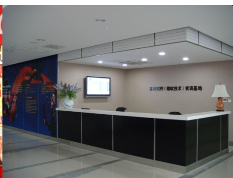
苏州软件（微软技术）实训基地前台