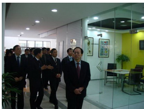
国家信息产业部副部长尙仲文到基地视察