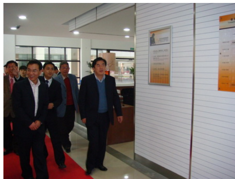
江苏省教育厅原厅长王斌泰到基地视察