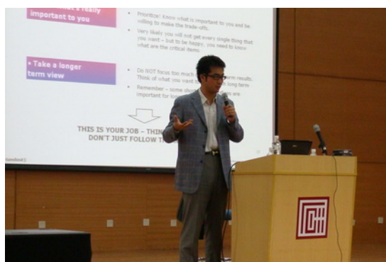
微软资深项目经理职业讲座: Career Go