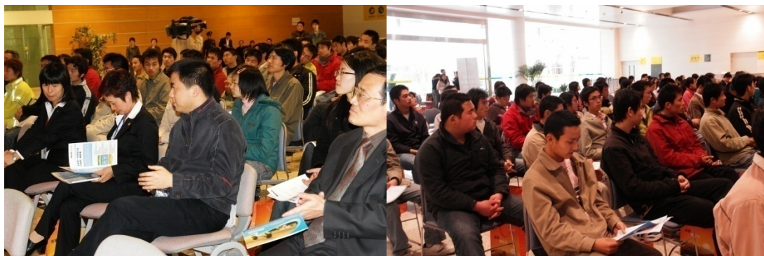
启动仪式现场企业合作方代表