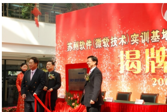
微软全球技术中心总经理柯文达为基地揭牌