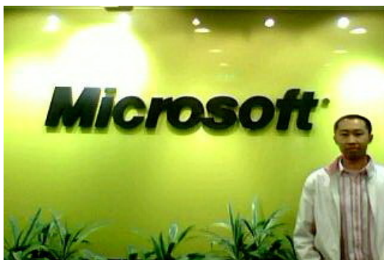
基地李考准等 3 位同学被微软公司录用