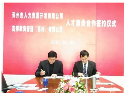
基地与苏州市人才服务中心共建软件人才开发中心