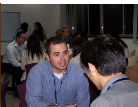
2008 年微软大学生实训营职场口语现场