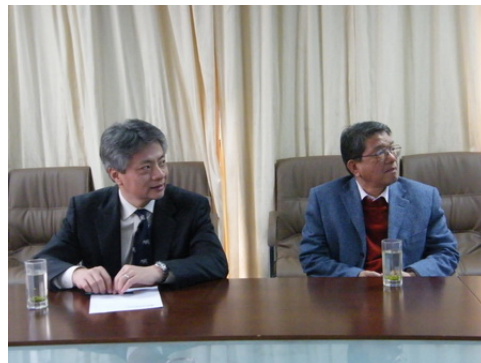
全球知名外包企业埃森哲总裁李纲到基地考察