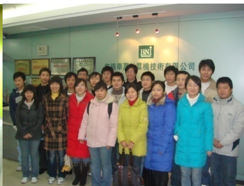
基地张马等 20 位同学被中国软件外包 25 强华夏公司录用