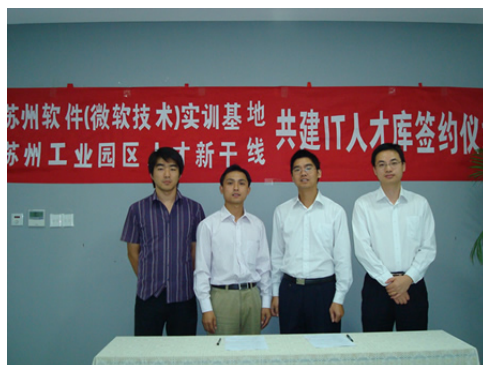
基地与苏州工业园区人才新干线共建 IT 人才库