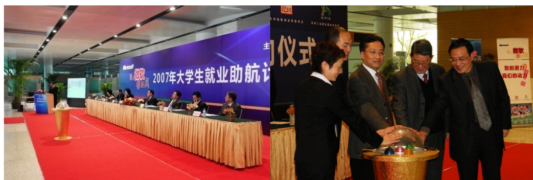
助航计划启动仪式主席台嘉宾