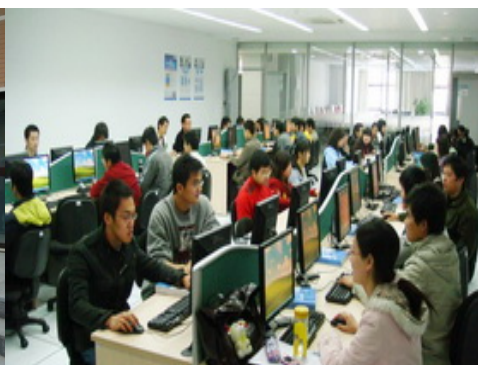
2008 年微软大学生实训营项目实训现场